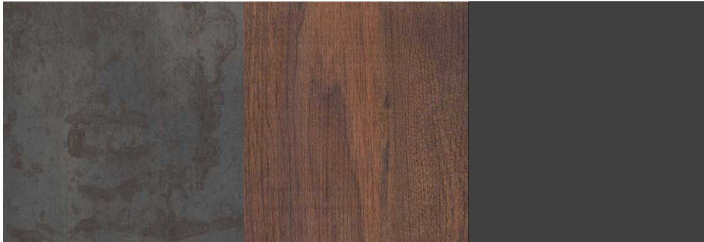
Tērauds F7478 PF