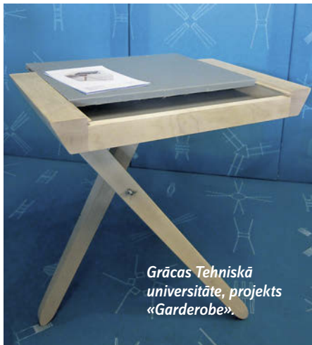
Grācas Tehniskā universitāte, projekts «Garderobe».